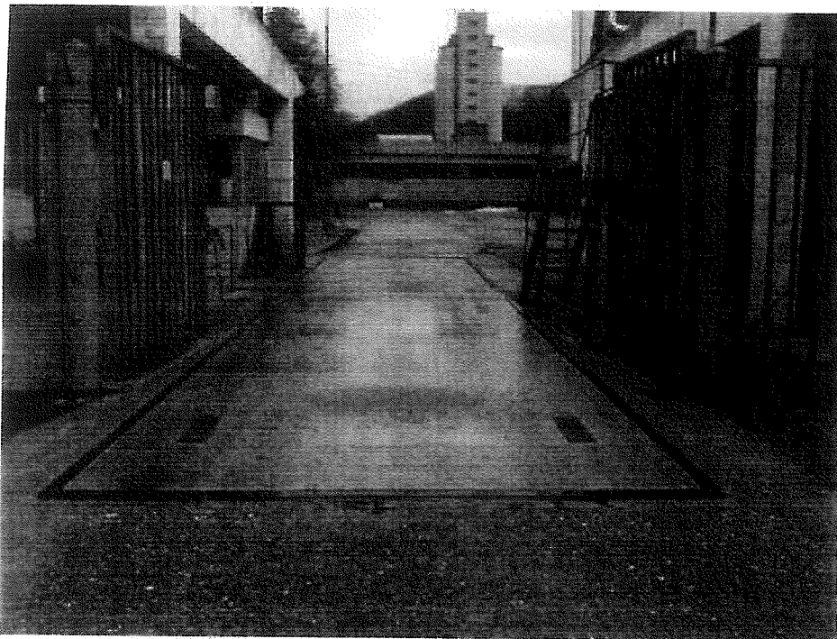
Miesto novej inštalácie váhy