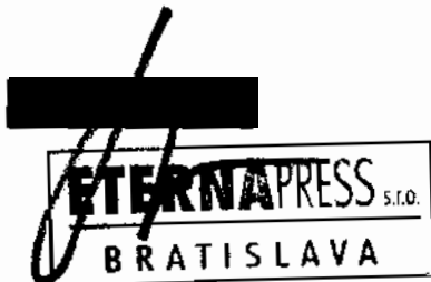
Dušan Babjak zhotoviteľ

Literárne informačné centrum: Nám. SNP 12 812 24 Bratislava IČO: 317 52 381 - 8 -