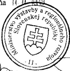
Za objednávateľa: Ing. Igor Štefanov minister