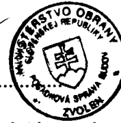
Libor Šimo vedúci skupiny špeciálnych činností Posádková správa budov Zvolen