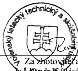
Za zhotoviteľa: Ing. Rudolf Slávka, CSc riaditeľ