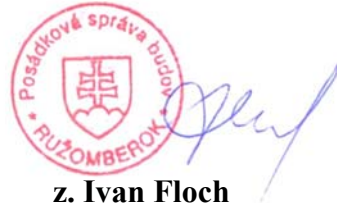
z. Ivan Floch OR – energetik PSB - RK