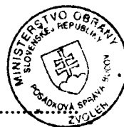
Libor Šimo vedúci skupiny špeciálnych činností Posádková správa budov Zvolen