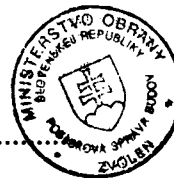
Libor Šimo vedúci skupiny špeciálnych činností Posádková správa budov Zvolen