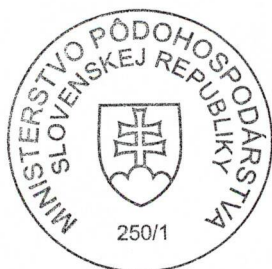
Ing. Vladimír Pavelka vedúci služobného úradu

túto zmluvu o výpožičke uzavretú dňa 18. decembra 2008 medzi požičiavateľom: Slovenskou republikou, zastúpenou správcom – Regionálna veterinárna a potravinová správa, Kalinčiakova 879 Vranov nad Topľou, IČO: 36165786 a vypožičiavateľom: Slovenskou republikou – zastúpenou Krajským lesným úradom v Prešove, Masarykova 10, 080 01 Prešov, IČO: 37938001, ktorej predmetom je výpožička nehnuteľného majetku štátu – kancelárske priestory o celkovej výmere 76,31m 2 , chodby o výmere 38,38 m 2 , sociálne zariadenia o výmere 13,97 m 2 spolu o celkovej výmere 128,48 m 2 nachádzajúce sa na I. poschodí v budove OVS na Kalinčiakovej ulici č.879, zapísanej na liste vlastníctva č.671,okres Vranov nad Topľou, obec Vranov nad Topľou, katastrálne územie Vranov nad Topľou, súpisné číslo 879 postavenej na pozemku parcele číslo 1446/1 zastavané plochy a nádvoría, na dobu určitú od 1. januára 2009 do 31. decembra 2013.