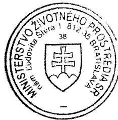
Ing Viliam Turský minister životného prostredia SR

Za Prijímateľa v Bojniciach, dňa : 19. 6. 2009