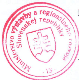
Ján Mikolaj podpredseda vlády a minister školy, poverený riadením MVRR SR