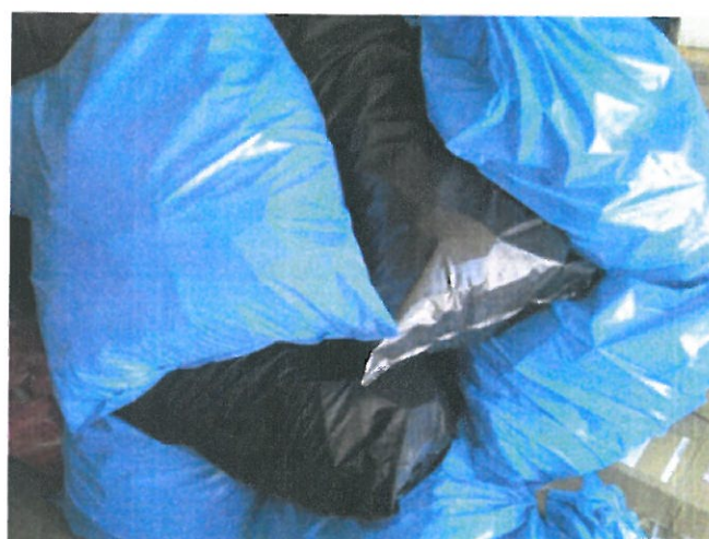
Obr. č. 2 Časť vytriedených liekov