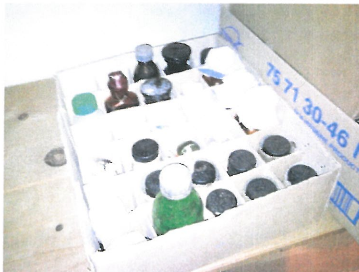
Obr. č. 5 Vytriedené jedy a zvlášť nebezpečné jedy