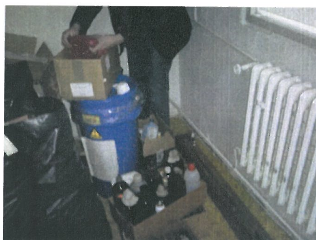
Obr. č.1 Odpad pred triedením